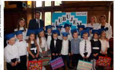
Dzieci ze Szkoły Podstawowej nr 2 im. Jana Heweliusza w Żukowie ślubowały w Ratuszu Staromiejskim w Gdańsku.