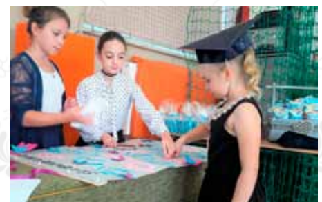
Pierwszoklasiści ze Szkoły Podstawowej im. Jana Pawła II w Borkowie przypieczętowali palcami, na specjalnej pamiątkowej planszy, to ważne wydarzenie w życiu ich i szkoły.