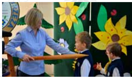
Ogromnym ołówkiem uroczystie pasowano na ucznia pierwszoklasistów w SP im. Obrońców Wybrzeża w Żukowie.

Podczas akademii uczniowie klas I zaprezentowali wiedzę i umiejętności, które zdobyli w pierwszym miesiącu nauki w szkole podstawowej. Pierwszoklasiści z wielkim zaangażowaniem recytowali wiersze i śpiewali hymn szkoły.