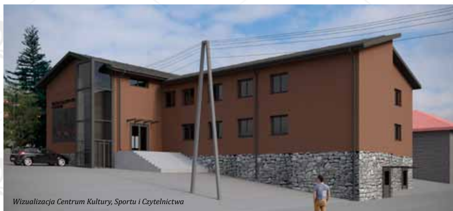
Wizualizacja Centrum Kultury, Sportu i Czytelnictwa

Ośrodek Kultury i Sportu w Żukowie oraz Biblioteka Samorządowa połączone zostaną w jedną instytucję kultury. Po pozytywnych rozmowach i konsultacjach z dyrektcją OKiS oraz Biblioteki Samorządowej, Rada Miejska w Żukowie 26 września br. podjęła uchwałę o zamiarze połączenia tych dwóch instytucji kultury w jedną o nazwie Centrum Kultury, Sportu i Czytelnictwa.