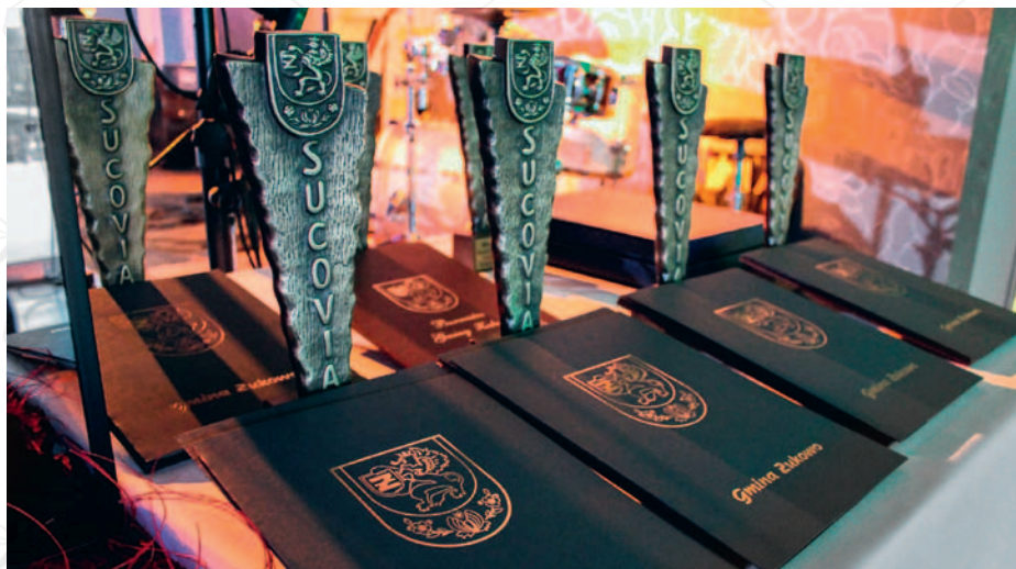
fol. OKiS w Żukowie

Szczególną nagrodą jest kategoria mecenasa czyli osoby lub instytucji wspierającej w znaczący