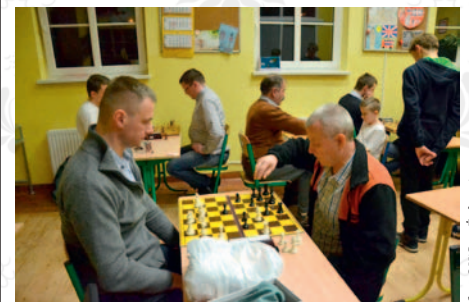
fol. OKiS w Żukowie