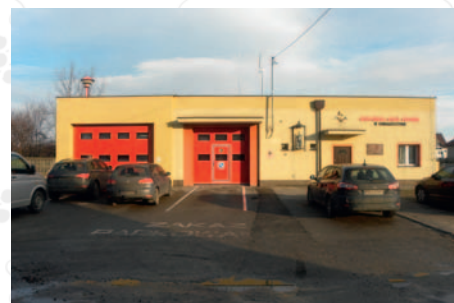
fol. Ug w Żukowie

Został rozstrzygnięty przetarg. Najniższą ofertę cenową (około 2 mln złotych) na realizację przedsięwzięcia złożyła firma Zakład Usług Remontowo-Budowlanych Apollo z Nowej Wsi koło Kościerzyny. Kwota przeznaczona na rozbudowę OSP w Chwaszczynie to 2 600 000 złotych. Przekazanie terenu budowy nastąpi do 31 marca 2017 r.