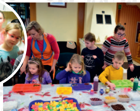
fol. OKiS w Żukowie