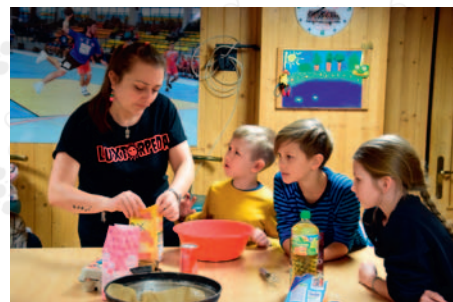
fol. OKiS w Żukowie

Zajęcia w siedzibie OKiSu odbywać będą się od 24 lipca do 6 sierpnia, natomiast w czwartki będziemy zabierać dzieciaki na wycieczki do różnych ciekawych miejsc. Szczegółowy plan zajęć dostępny będzie na stronie www.okis-zukowo.pl w połowie czerwca.