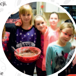
fol. OKiS w Żukowie