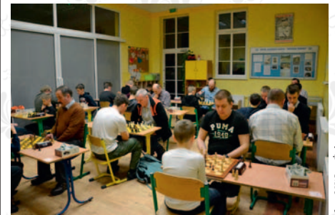
fol. OKiS w Żukowie