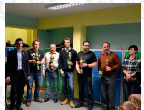
fol. OKiS w Żukowie