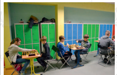
fol. OKiS w Żukowie