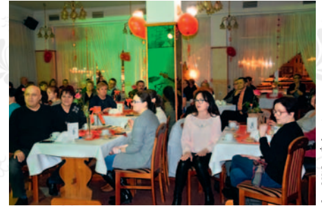
fol. OKiS w Żukowie