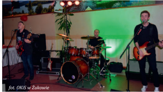
fol. OKiS w Żukowie

Tegoroczną gwiazdą Muzycznych Walentynek organizowanych przez Ośrodek Kultury i Sportu w Żukowie był zespół „Trzy Gitary”. Muzycy tercet zaprezentował przeboje „Czerwonych Gitar” i „Trzech Koron”. W piątkowy wieczór sala Restauracji „Gryf” była wypełniona słuchaczami. Każdy z gości otrzymał nie tylko ucztę duchową, ale również słodki poczęstunek.