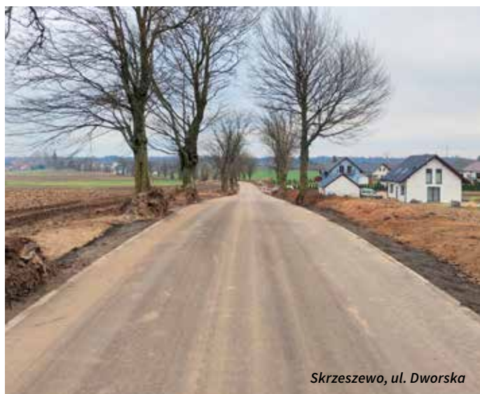
Skrzeszewo, ul. Dworska