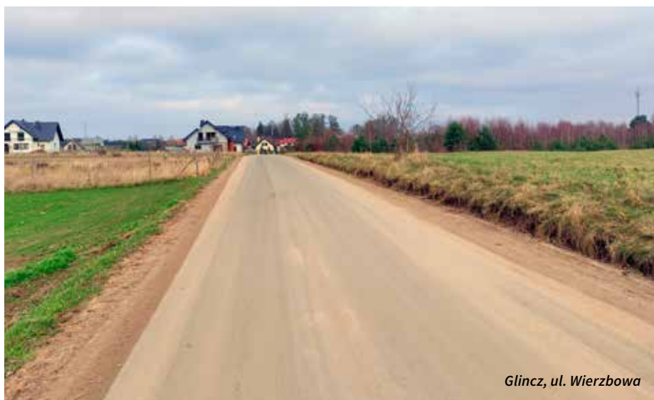
Glincz, ul. Wierzbowa