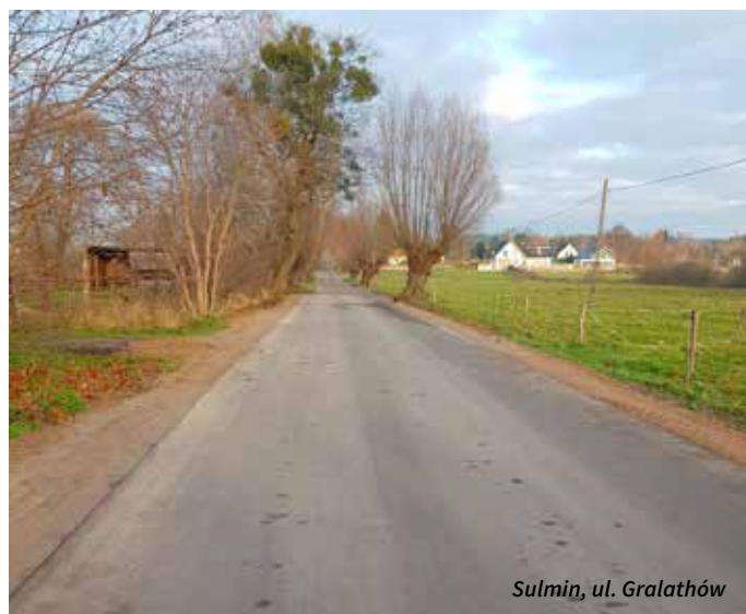
Sulmin, ul. Gralathów