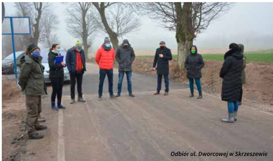
Odbiór ul. Dworcowej w Skrzeszewie