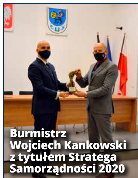
Burmistrz Wojciech Kankowski z tytułem Stratega Samorządności 2020