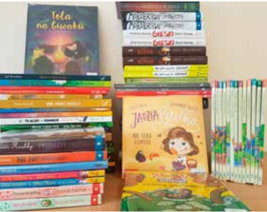
Nowości w bibliotece w Baninie

Co czytają mieszkańcy Gminy Żukowo i jak Biblioteka Samorządowa w Żukowie odpowiada na ich potrzeby czytelnicze? Z jakich środków realizowane są zakupy książek i w końcu kto decyduje o tym, co znajdzie się na półce z nowościami rozmawiamy z pracownikami naszej Biblioteki.