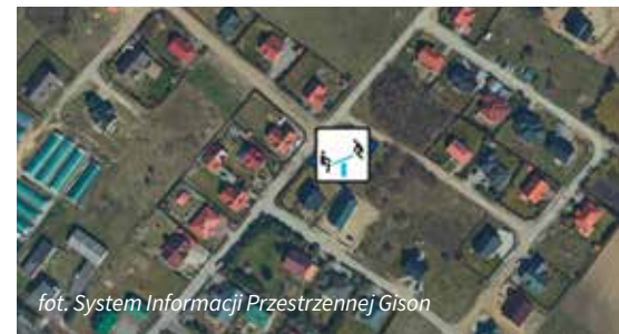
fot. System Informacji Przestrzennej Gison