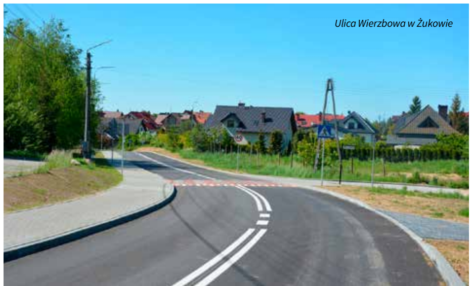
Ulica Wierzbowa w Żukowie

(powierzchnia 120 m 2 ). Koszt tej inwestycji to 107 617,74 zł z czego środki z funduszu sołeckiego to 24 000 zł. Również w Chwaszczynie na ul. Norwida powstała nawierzchnia z kostki betonowej o długości 100 mb i szerokości zmiennej 5 - 6 mb wraz z wjazdami oraz chodnik z kostki betonowej o długości 45 mb i szerokości 1,3 mb za kwotę 182 993,37 zł (w 2019 r. na te inwestycje przeznaczono 64.976,72 zł). W maju br. ukończono budowę ul. Siostry Faustyny i ul. Wierzbowej na osiedlu Nowe w Żukowie. Powstała nawierzchnia bitumiczna o łącznej długości ok. 330 m i szerokości 6 m wraz z chodnikiem, odwodnieniem i oświetleniem za kwotę 863 478,58 zł. Zadanie zrealizowano z 50% dofinansowaniem z Funduszu Dróg Samorządowych.