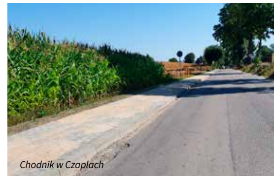
Chodnik w Czaplach