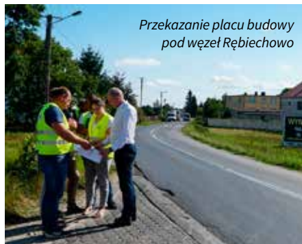
Przekazanie placu budowy pod węzeł Rębiechowo

W Babim Dole wykonano nawierzchnię z kostki betonowej o dł. 80 mb i szer. 4,0 m (powierzchnia 320 m 2 ) oraz chodnik z kostki betonowej o dł. 80 mb i szerokości 1,5 m