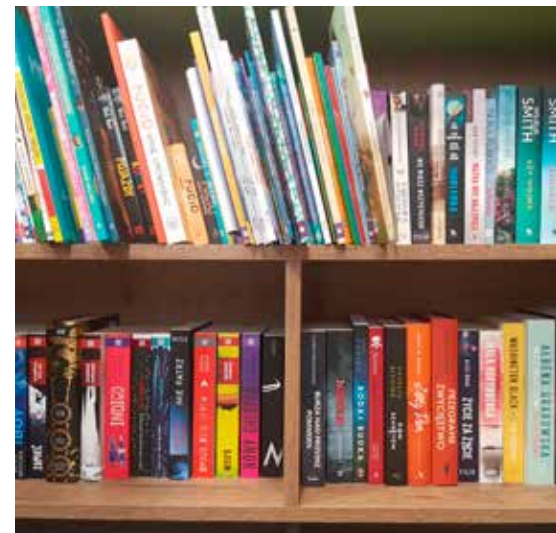
Nowości w bibliotece w Żukowie

Tekst i foto: Biblioteka Samorządowa w Żukowie