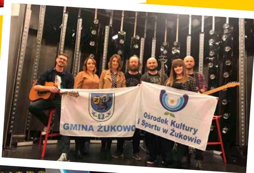
Zespół „Czarodzieje z Kaszub” w studio Familiady