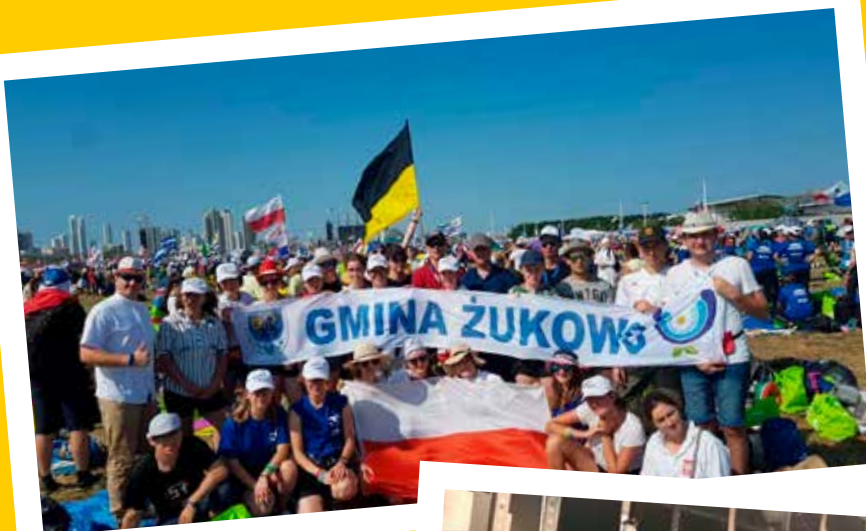
Światowe Dni Młodości w Panamie

Minione tygodnie pokazały, że mieszkańcy naszej gminy chętnie promują ją nie tylko na terenie kraju, ale i za granicą. Zespoły muzyczne odwiedzają studia filmowe, a wierni z żukowską flagą podróżują w odległe miejsca na świecie.