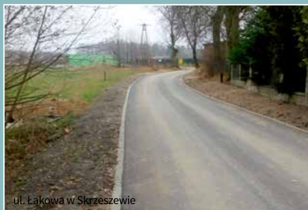
ul. Łąkowa w Skrzeszewie