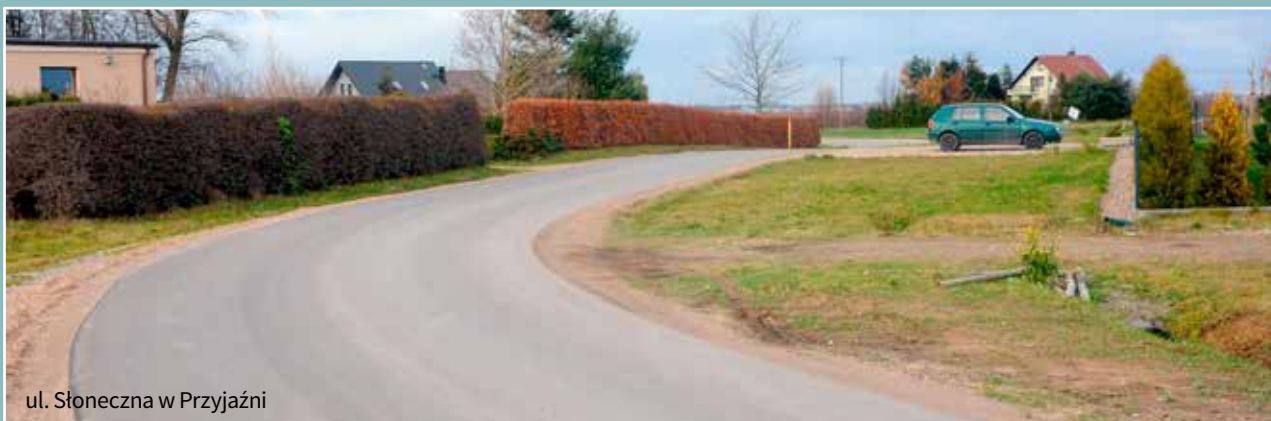
ul. Słoneczna w Przyjaźni