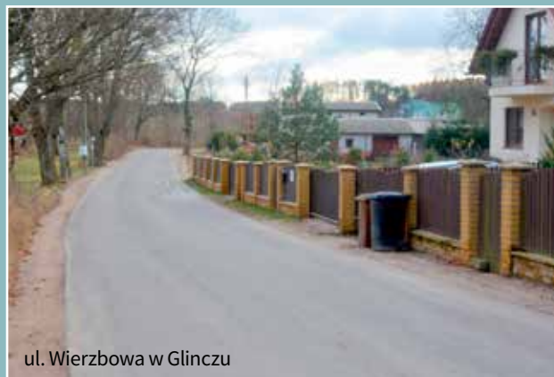
ul. Wierzbowa w Głinczu