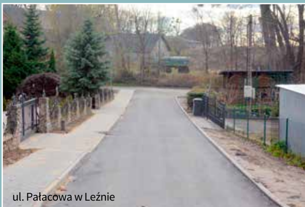
ul. Pałacowa w Leźnie