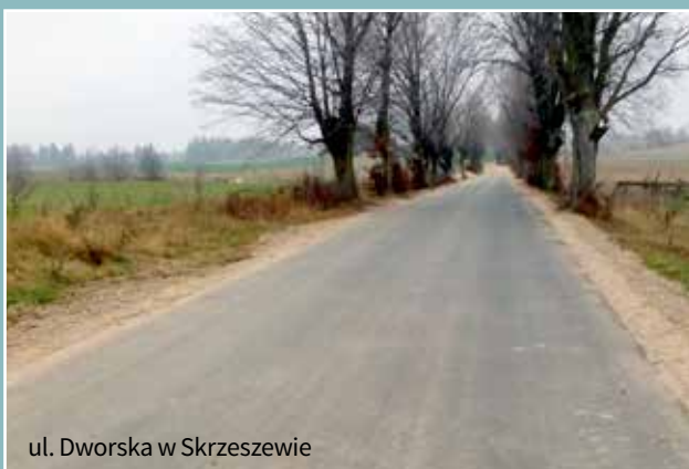
ul. Dworska w Skrzeszewie