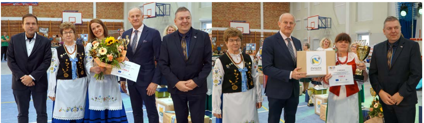
Kategoria Moda - Z morskiej toni – zwycięzca KGW Gniezdzewo