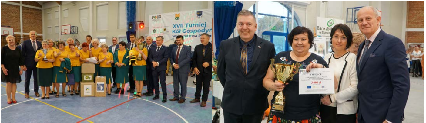
GRAND PRIX – KGW Skowarcz