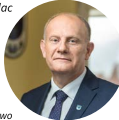
Wojciech Kankowski • Burmistrz Gminy Żukowo

Na koniec gratuluję wszystkim laureatom i nominowanym do Gminnej Nagrody Sucovia! Dziękuję za Waszą aktywność i promocję naszej Gminy!