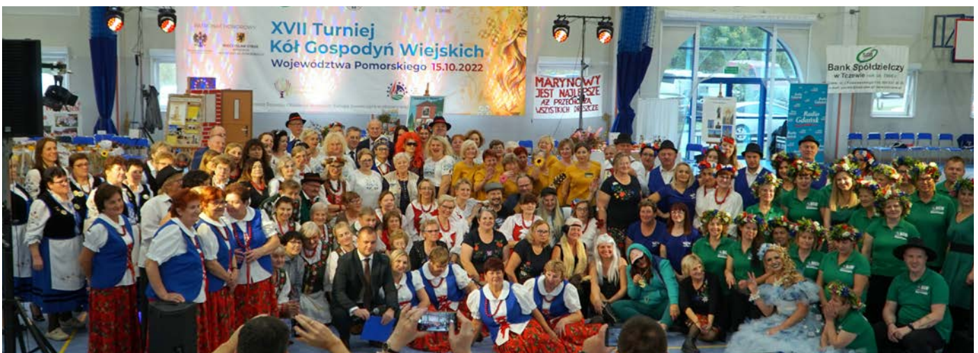
Kategoria Scenka kabaretowa - Czy kuma słyszata, że... - – zwycięzca KGW Łyśniewo Sierakowickie