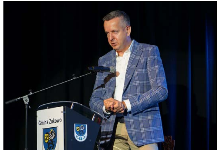
Kategoria Gospodarka, NAGRODA - STEN Sp. z o.o.