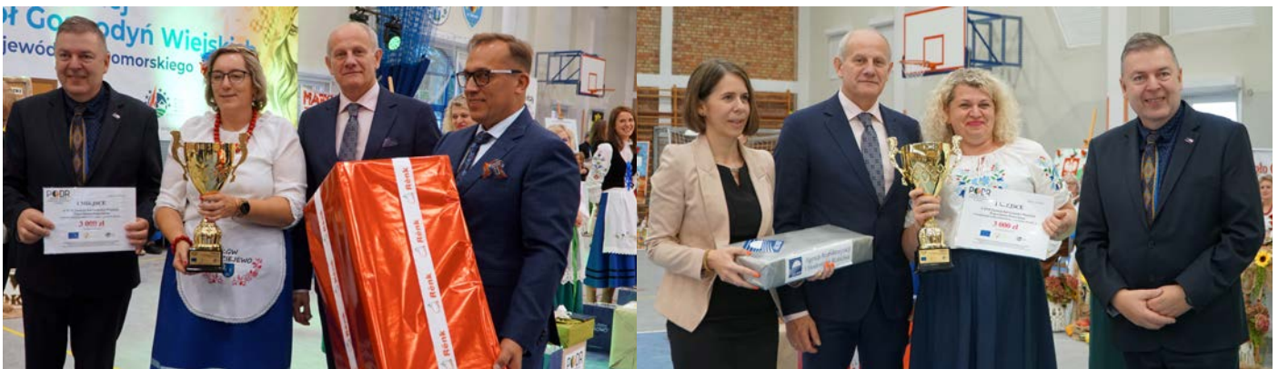
Kategoria Produkt tradycyjny - Produkty mięsne – zwycięzca KGW Nadziejewo