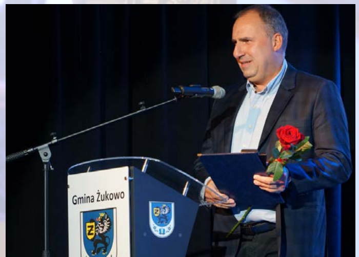
Nagroda Honorowa - Mecenas, NAGRODA - Autoinvest Group Sp. z o.o. Sp. komandytowa