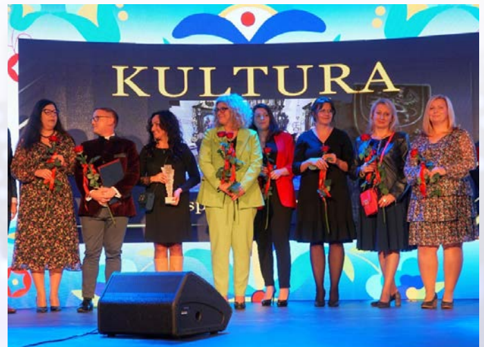
Kategoria Kultura, NAGRODA - Zespół Norbertanki z Żukowa