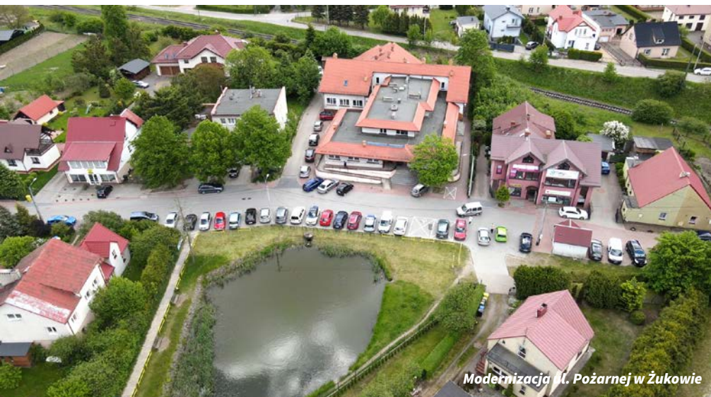
Modernizacja ul. Pożarnej w Żukowie