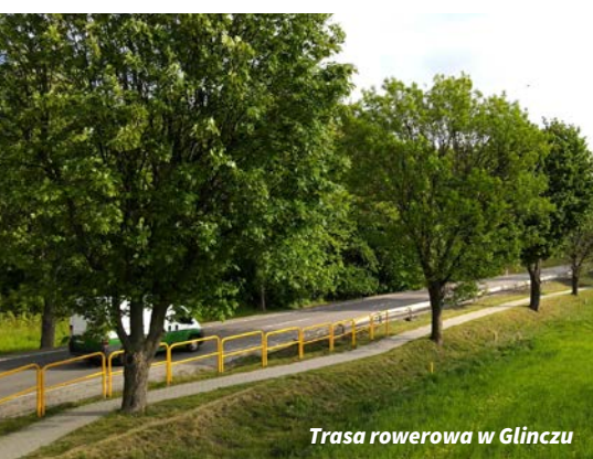
Trasa rowerowa w Głinczu