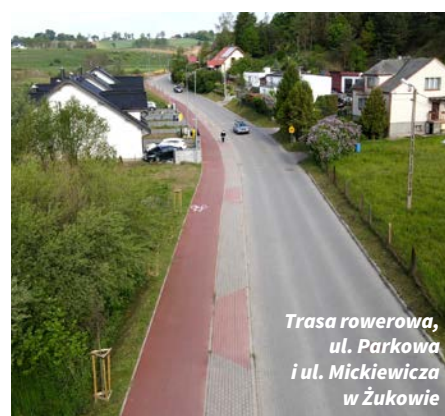
Trasa rowerowa, ul. Parkowa i ul. Mickiewicza w Żukowie

Węzeł w Żukowie jest jednym z 26 centrów przesiadkowych budowanych na terenie naszej metropolii w ramach współpracy z Obszarem Metropolitalnym Gdańsk-Gdynia-Sopot. W ramach wszystkich inwestycji powstanie łącznie ponad 2800 miejsc parkingowych dla samochodów, blisko 2500 miejsc dla rowerów oraz zbudowanych będzie ponad 110 km dróg rowerowych. Wartość wszystkich projektów to ponad 750 mln zł, w tym 330 mln zł stanowi dofinansowanie z funduszy europejskich.