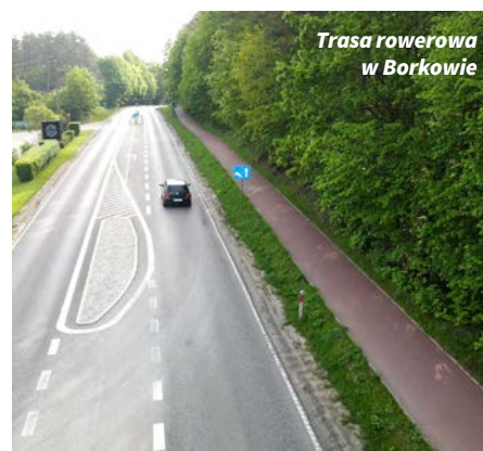
Trasa rowerowa w Borkowie