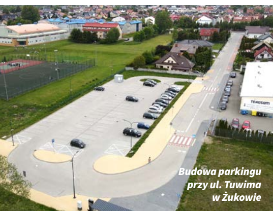
Budowa parkingu przy ul. Tuwima w Żukowie