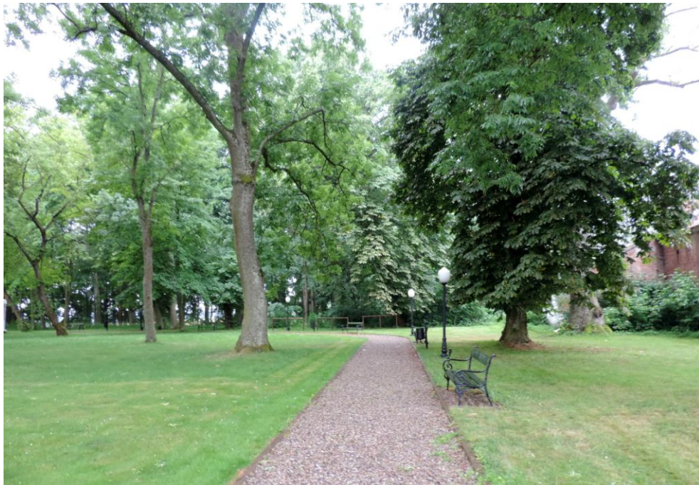
Widok od północnego-wschodu

8. Fotografia z opisem wskazującym orientację albo mapa z zaznaczonym stanowiskiem archeologicznym