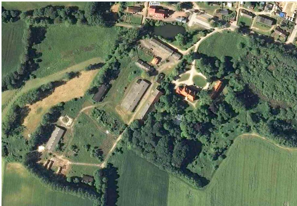
Widok z lotu ptaka

8. Fotografia z opisem wskazującym orientację albo mapa z zaznaczonym stanowiskiem archeologicznym