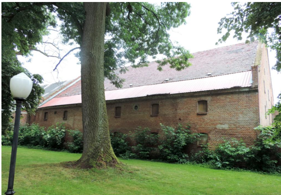
Widok budynku od południowego-wschodu

8. Fotografia z opisem wskazującym orientację albo mapa z zaznaczonym stanowiskiem archeologicznym