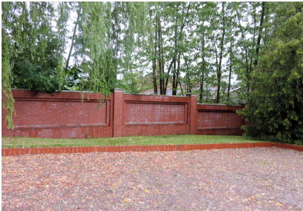
Widok od północnego-wschodu

8. Fotografia z opisem wskazującym orientację albo mapa z zaznaczonym stanowiskiem archeologicznym