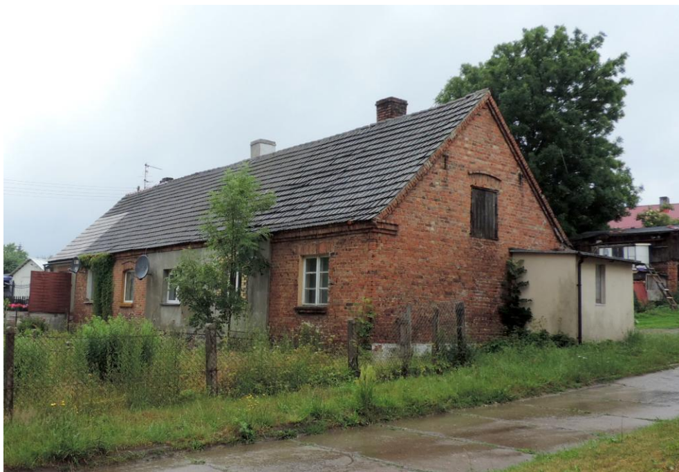
Widok budynku od południowo-wschodu

8. Fotografia z opisem wskazującym orientację albo mapa z zaznaczonym stanowiskiem archeologicznym