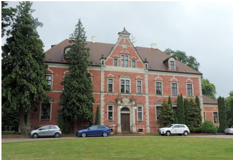
Widok budynku od północnego-wschodu

8. Fotografia z opisem wskazującym orientację albo mapa z zaznaczonym stanowiskiem archeologicznym