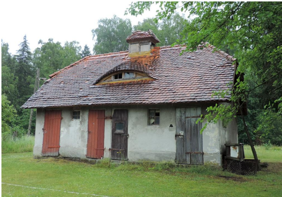
Widok budynku od północnego-zachodu

8. Fotografia z opisem wskazującym orientację albo mapa z zaznaczonym stanowiskiem archeologicznym