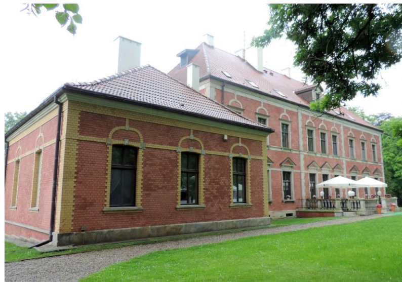
Widok budynku od południowego-zachodu