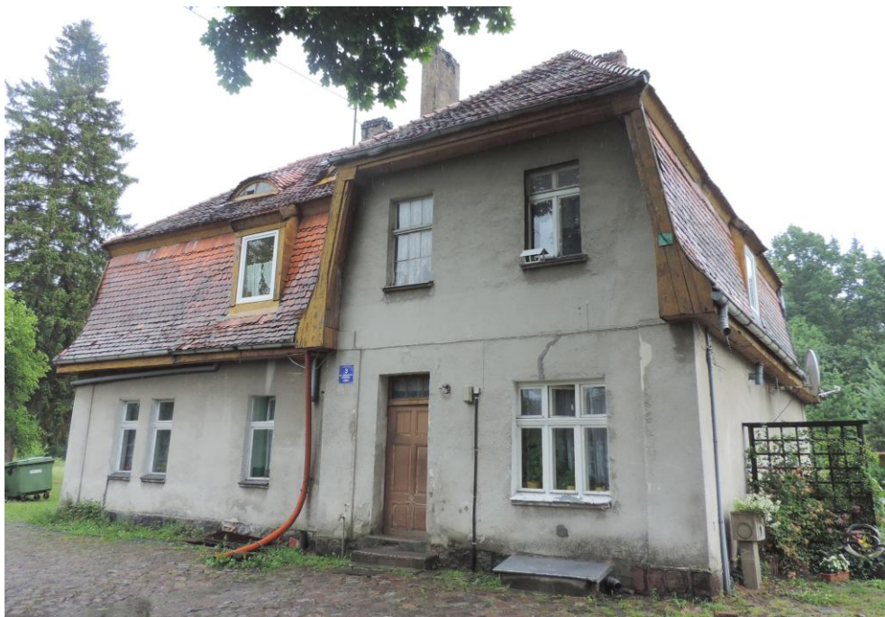
Widok budynku od północnego-zachodu

8. Fotografia z opisem wskazującym orientację albo mapa z zaznaczonym stanowiskiem archeologicznym