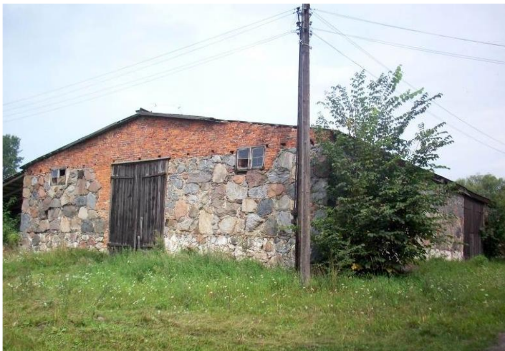
Widok budynku od północy

8. Fotografia z opisem wskazującym orientację albo mapa z zaznaczonym stanowiskiem archeologicznym