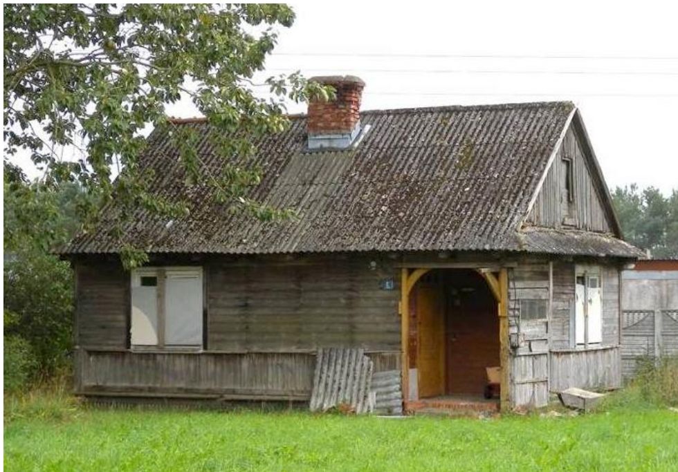
Widok budynku od północy

8. Fotografia z opisem wskazującym orientację albo mapa z zaznaczonym stanowiskiem archeologicznym