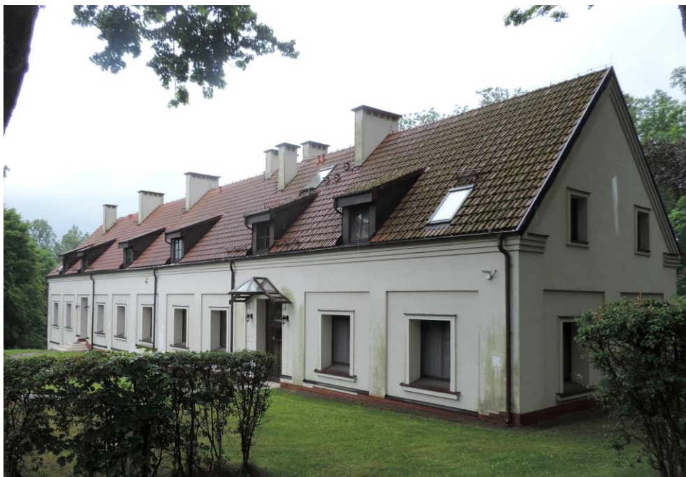
Widok budynku od południowo-zachodu

8. Fotografia z opisem wskazującym orientację albo mapa z zaznaczonym stanowiskiem archeologicznym