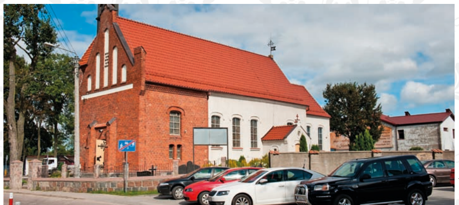
fol. UC Żukowo

W pierwszym tysiącleciu przed Chrystusem mieściła się tam duża osada, co poświadczają bogate znaleziska archeologiczne z pismem runicznym. W czasach historycznych wieś początkowo należała do książąt pomorskich. W latach 1249 – 1282 Wassino (Chwaszczyno) było własnością żukowskich norbertanek. Swoje prawa do wsi rościli sobie także cystersi z Oliwy. W tym czasie już prawdopodobnie wybudowano we wsi mały kościółek. W 1301 roku Chwaszczyno stało się własnością biskupów kujawskich. W XV wieku wieś liczyła 41 łanów chłopskich, 5 sołeckich i 4 plebańskie. Do dóbr biskupich należały także jeziora Osowskie, Bobowo i połowa Jeziora Wysockiego. We wsi były także staw rybny, karczmy i młyn. W XVI wieku do parafii chwaszczyńskiej dołączono Kack, gdyż tamtejszy kościół zburzyli luteranie. Jednak po reformacji długo nie było