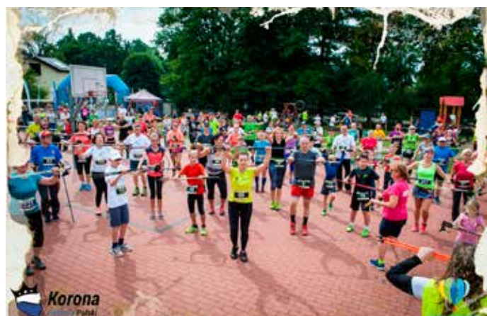
Tekst i zdjęcie ze strony www.chodzejkijami.pl

W Żukowie na każdego uczestnika czekały pakiety startowe w postaci toreb z gadżetami i napojami ufundowanych wspólnie przez organizatorów imprezy – Stowarzyszenie Turystyczne Kaszuby, Ośrodek Kultury i Sportu w Żukowie i Fundację Chodzejkijami.pl.